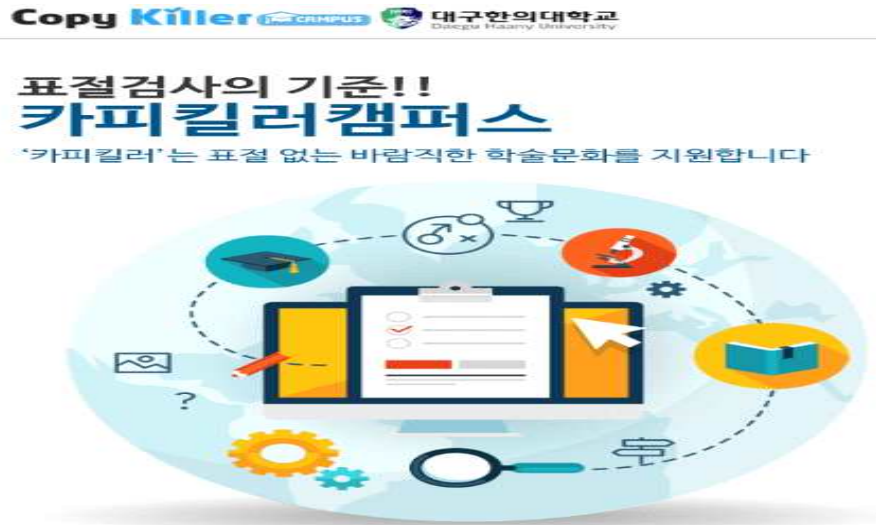
<그림 4-3-1-1> 대구한의대학교 논문표절검사프로그램