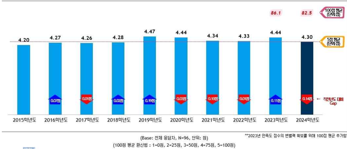
[ 연도별 종합 만족도 ]