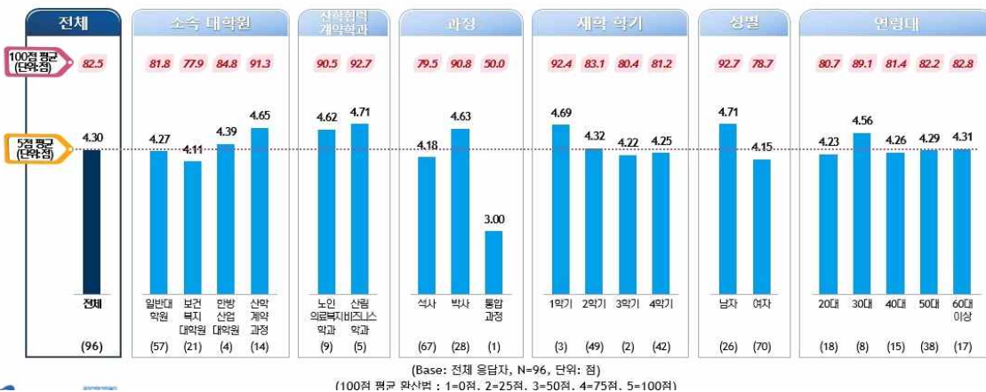
[ 영역별 종합 만족도 ]

대학원생의 영역별 종합 만족도는 5점 평균 기준 4.30점, 100점 평균 기준 82.5점임 소속별로는 산학계약과정, 과정별로는 박사, 연령대별로는 30대의 만족도 상대적으로 높음